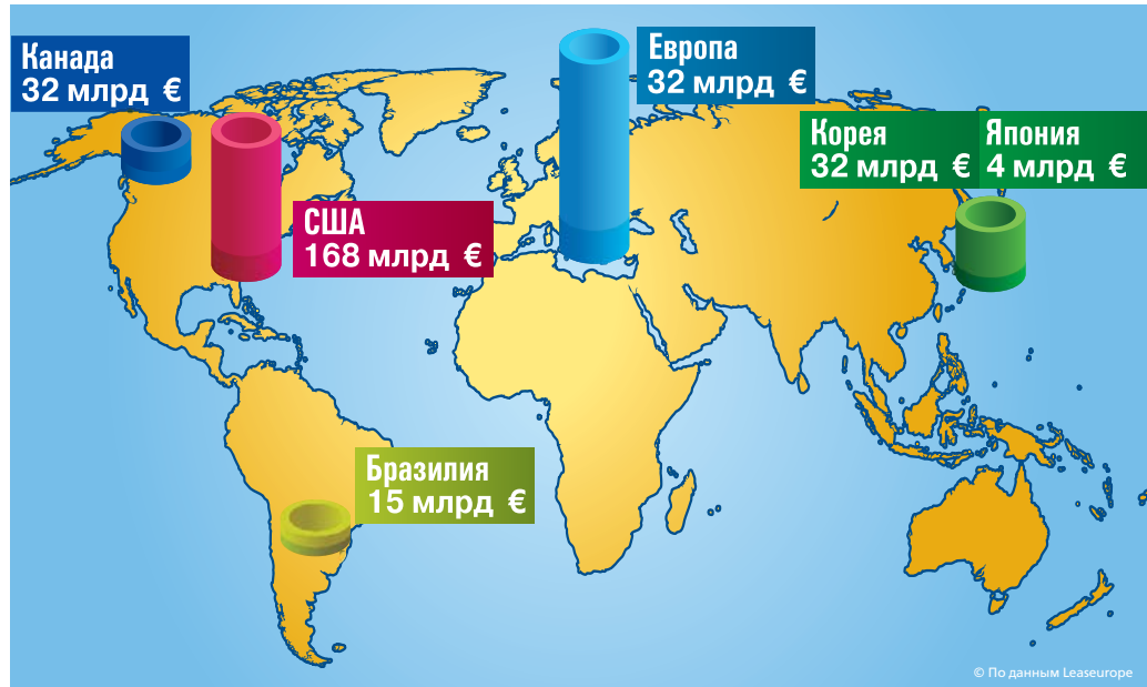
Диаграмма 3. Значение лизинга для экономики в целом

Также государству давно пора упростить схему регистрации транспортных