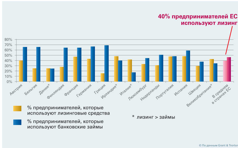
Диаграмма 1. Источники финансирования малого и среднего бизнеса в ЕС

основном рассчитывают на лизинговые средства. Так, около 40 % европейских фирм используют лизинг. Такая популярность лизинга среди малого и среднего бизнеса вызвана тем, что это более дешевый, а иногда и единственный, источник средств для развития своего дела. И когда предприниматель сравнивает условия по кредитованию и лизингу, он чаще выбирает последний из-за возможности не оставлять залог, получить налоговые льготы и минимизировать стоимость оформления автомобиля.